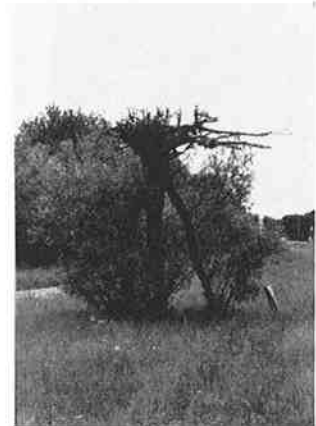
Rond 2000: de omgekeerde boom met zijn wortels in de lucht.

Op de Haagsche Schouwweg tegenover begraafplaats Rhijnhof ter hoogte van de bloemenkiosk staat "onze" omgekeerde boom: Salix alba 'Tertia regna' de onderwereld-wilg. Een groen kunstwerk uit 1997. Behorend bij een project landschapskunst van de Gemeente Leiden. De boom intrigeert me al jaren. En heb ik op de voet gevolgd. Op het voorblad van Bockepraat nr. 03 uit 2008 staat nog een oude foto. De oorspronkelijke wortels van de onderwereld-wilg hangen nog in de lucht. Hier nogmaals de foto. De top van de boom is al lekker geworteld en vele nieuwe takken zijn ontsproten. Momenteel is de boom weer zodanig boom geworden dat men de "kruin": het oude wortelstelsel, eruit gezaagd heeft. De boom is bijna niet meer te herkennen als omgekeerde boom.