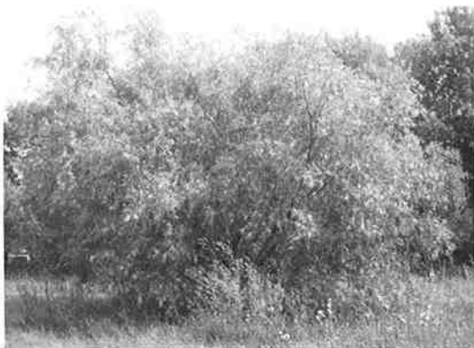
Juni 2009: de omgekeerde boom lijkt weer een gewone boom.

Zover ik heb kunnen naspeuren is de wilg omgekeerd geplant na vele jaren als gewone boom te hebben geleefd. Het motto was volgens mij: al staat de natuur op zijn kop, de natuur overleeft altijd. Een mooi motto en ook toepasbaar op ons leven als mensen. Wie kent geen tegenslag in zijn/haar leven waarbij u het gevoel hebt dat het nooit meer goed komt? Deze boom leert ons aanvaarden en tegenslag te accepteren. Sterker nog: uw groei gaat, zelfs omgekeerd, gewoon door.