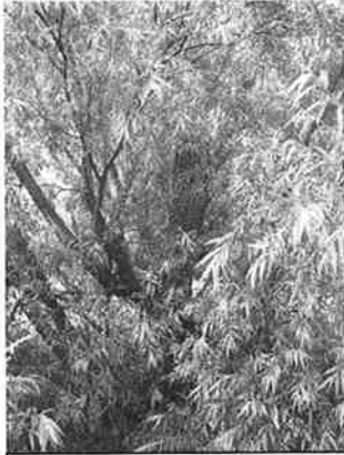
Juni 2009: de afgezaagde "kruin" wortels

vogels zullen dankbaar gebruik maken van hun nieuwe nest- en voedselgelegenheid..."