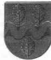
Wapen van Bockhorst

Zag ik het wel goed, en vroeg dit ook aan mijn vrouw die murmelde iets van ...niks gezien hoor. Ik vroeg mijn vriend even te draaien en een stuk terug te rijden. En...ja hoor een groot bord met opschrift BOCKHORST. Boven de tekst zag ik later wel dat er ook Gemeinde stond.